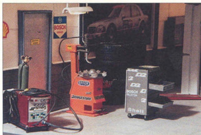
De apparatuur is net echt.