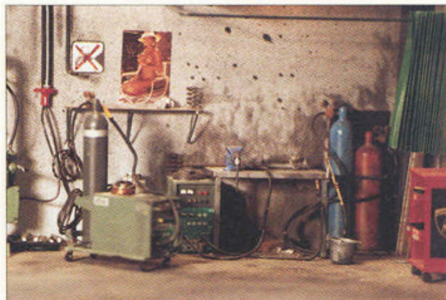
Een sfeervol hoekje.