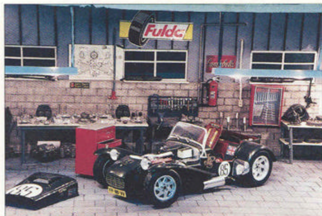
Super Seven in de werkplaats.

die omgeven worden door tal van speciale boormachines en allerhande ander materiaal. En passant vist hij een boormachi-