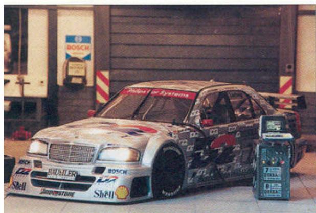
Het beeldscherm van de testbank is verlicht.