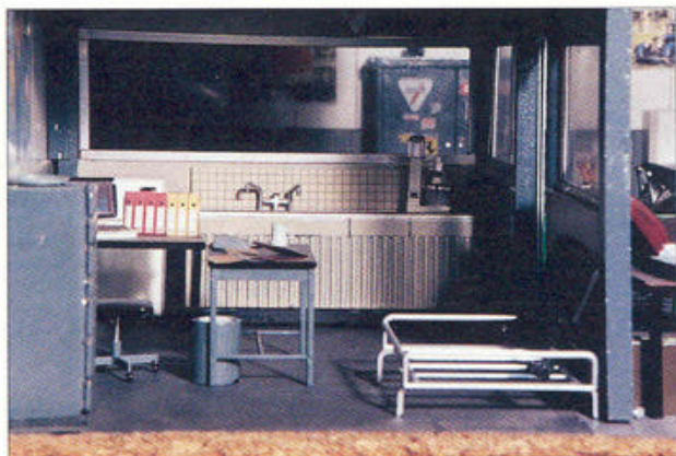
Ordnars op het bureau