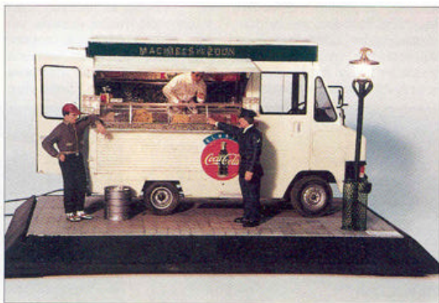
De Toyota frites-mobiel van Machiels & Zoon.