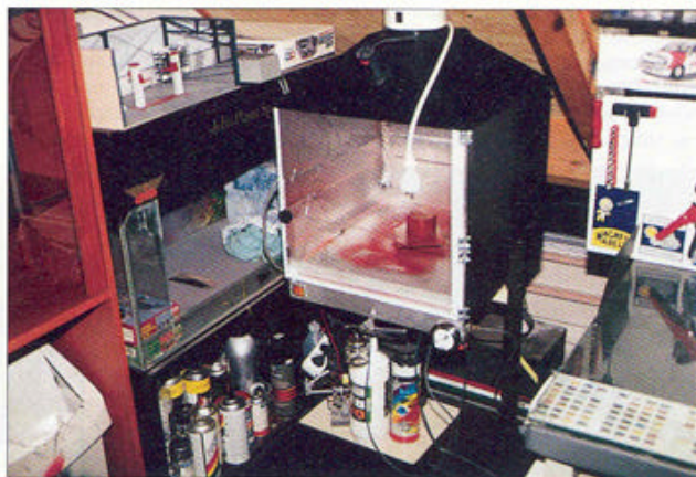
De zelf gemaakte spuitcabine.